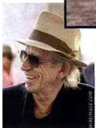
Madonna, Demi Moore et Keith Richards font parti des hôtes prestigieux ayant séjourné dans ce refuge pour célébrités. Le rocker y possède même une villa, The Rocky Point .