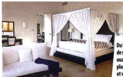
Du bâtiment principal de style colonial à l'univers ouaté des villas de plage, entre lit à baldaquin et voilages légers, le resort invite aux délices de l'art de vivre caribéen.