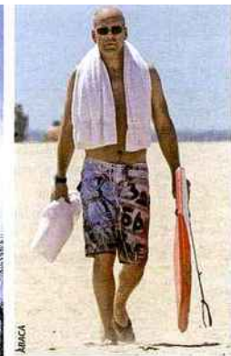
Habitué de Parrot Cay, Bruce Willis passe de longues semaines dans l'intimité de sa propriété, The Residence , en compagnie de sa femme, Emma Heming, épousée ici-même en 2009.