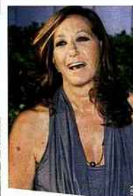
Avec The Sanctuary , la styliste new-yorkaise Donna Karan possède la villa la plus spectaculaire de l'île. Ce bijou d'architecture asiatique en bois exotique domine la mer des Caraïbes.